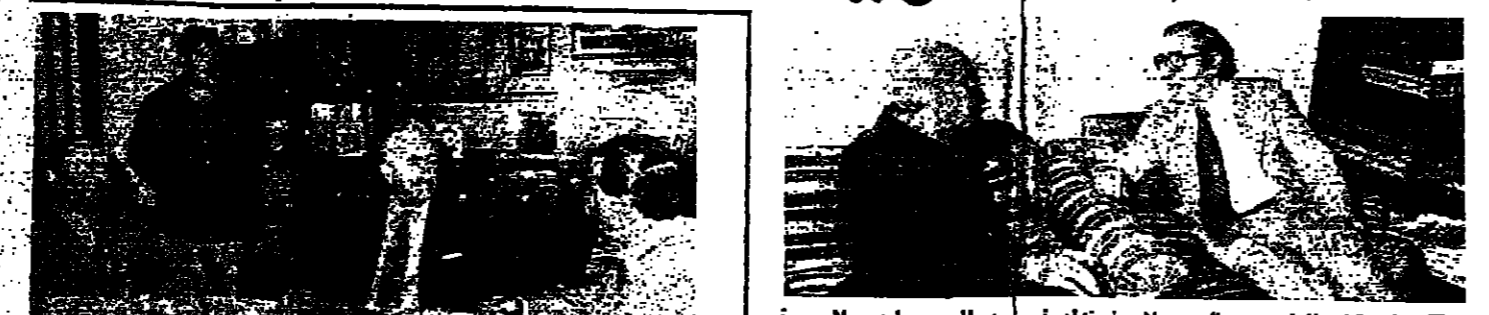
استقبل الرئيس صائب سلام في منزله أمس ، السيد وليد صلاح من الأردن في لبنان بمناسبة عودته إلى بيروت . وجرى خلال المقابلة عرض للأوضاع العربية بصورة عامة والمعلومات الثنائية بين لبنان والأردن . وفي الصورة الرئيس سلام يتبادل الحديث مع السيد صلاح .

مهلة السبوع التي أعطاهم التحالف الثلاثي ، خلال اجتماعه أول أمس في منزل السيد ريمون أده ، لم تكن شرطا لتأليف الوزارة أو الاعتذار عما أكد الرئيس صائب سلام ، أمس ، بل كلفت بداية عملية مناقشة مشروع حل يسهل مهمة الرئيس المكلف لتشكيل الوزارة .